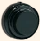
Serrure à combinaisons